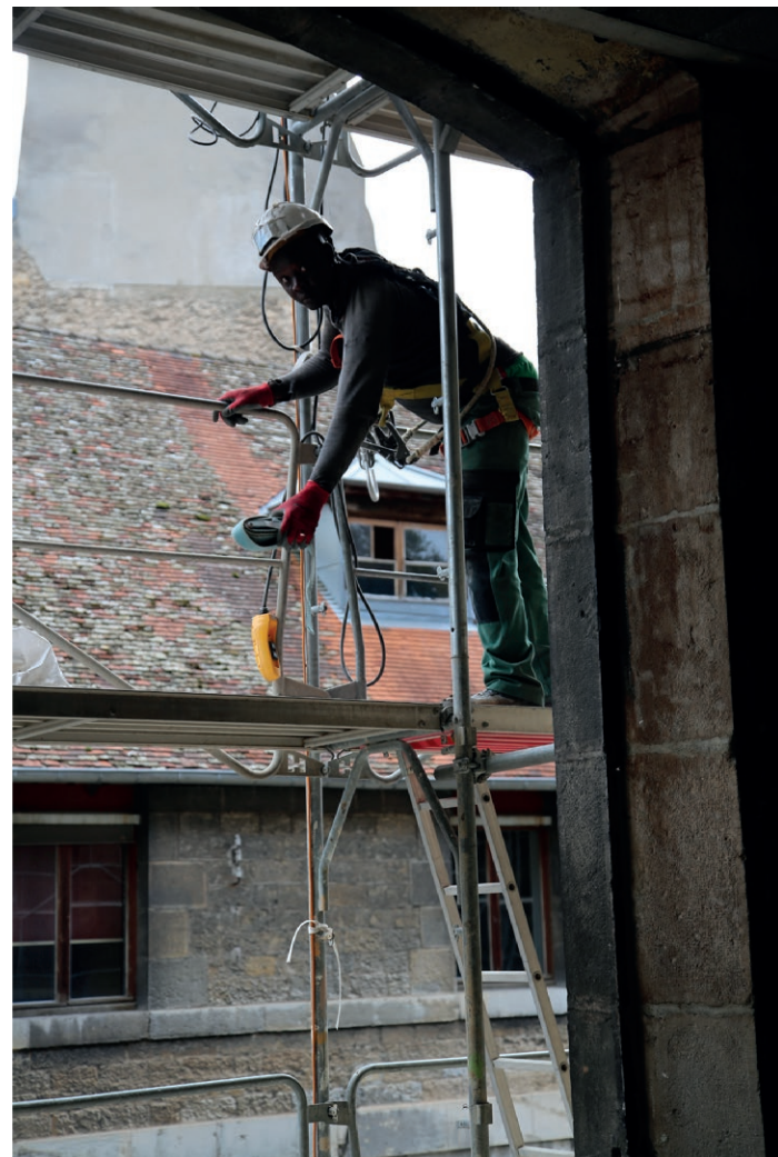
Montage des échafaudages