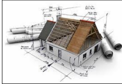
Concepteur / Prescripteur