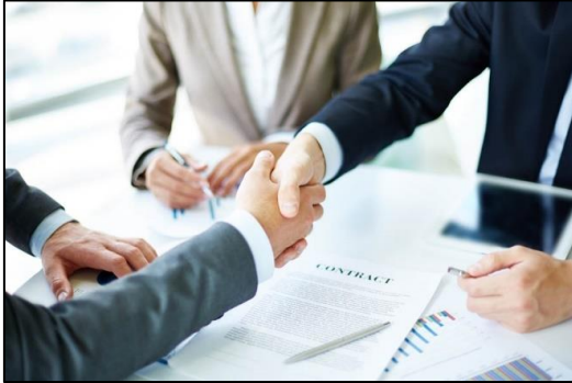
Commande / Conseils