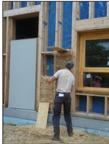
Réalisateur / Poseur